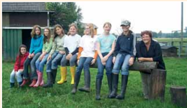
In Begleitung von Betreuern erleben die Kinder und Jugendlichen eine tolle Zeit und lernen in Theorie und Praxis über den Tierschutz

Beim aktion tier -Projekt „Tier- und Naturschutzferien“ werden in unterschiedlichen Kursen Kindern und Jugendlichen relevante Themen des Arten- und Naturschutzes vermittelt. Auch 2009 haben Kinder die Möglichkeit, Einrichtungen und Kooperationspartner von aktion tier kennen zu lernen und zu erfahren, was Tierschutz auch im Alltag bedeutet. Die genauen Ferientermine erhalten Sie in unseren Geschäftsstellen.