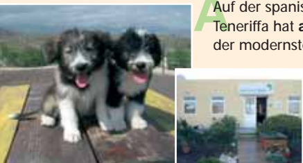
Die hohe Vermittlungsquote der Hunde macht Mut!

Auf der spanischen Ferieninsel Teneriffa hat aktion tier 2006 eines der modernsten Tierheime Europas eröffnet. 10 000 m 2 Gelände mit eigener Tierarztpraxis stehen den Hunden, die in Gruppenhaltung in weitläufigen Innen- und Außenwärgern leben, zur Verfügung.