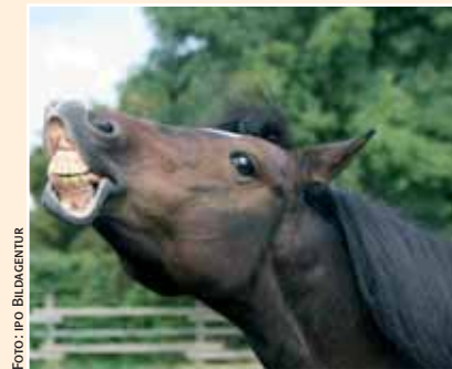
aktion tier hat neben seinen rund 180 Kooperationspartnern auch mehrere eigene Projekte