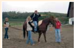
Das therapeutische Reiten hilft bei motorischen Schwierigkeiten und steigert das Selbstbewusstsein

2006 wurde der Pferdehof Gut Kaltenberg in Tettang/ Baden-Württemberg offiziell eröffnet. aktion tier wurde die Möglichkeit gegeben, einen Hof für Pferde ins Leben zu rufen, die, aus schlechten Haltungsbedingungen kommend, hier ihr Gnadensbrot erhalten. Als Gemeinschaftsprojekt mit der Stiftung Liebenau konzipiert und umgesetzt, hat aktion tier erstmals einen Partner für ein Vorhaben gewonnen, dessen Schwerpunkt seiner gemeinnützigen Arbeit nicht im Bereich des Tierschutzes liegt. Die Stiftung Liebenau verfügt über eine langjährige Tradition und Erfahrung in der Behinderten- und Altenbetreuung. Ziel dieses einmaligen Pferdehofes ist es, die Bereiche des Tierschutzes und der Behindertenarbeit miteinander zu verbinden. Auf diese Weise erhalten die Pferde die notwendige Betreuung und gewähren gleichzeitig einen therapeutischen Effekt, der sich auf die Lebensqualität der Menschen positiv auswirkt. Seit 2008 wird auch das therapeutische Reiten angeboten, das sich bei Menschen mit körperlicher und/ oder geistiger Behinderung bewährt hat.