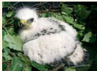
Verletzt oder verwaist aufgefundene Wildtiere, wie hier ein junger Mäusebussard werden in den Wildtierstationen aufgezogen, gepflegt und in die Natur entlassen.

Aktion tier – menschen für tiere e.V. fördert Arten- und Naturschutzprojekte über zahlreiche Kooperationspartner. In der aktion tier -Wildtier- und Artenschutzstation in Sachsenhagen, Niedersachsen, werden vor allem beschlagnahmte Exoten oder Wildtiere aus nicht genehmigter Haltung betreut, bis eine dauerhafte, artgerechte Unterbringung gefunden ist.