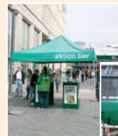
Die Mitarbeiter für die Öffentlichkeitsarbeit von aktion tier sind Wochentags immer für Sie da! Kommen Sie gerne vorbei!

Immer wieder werden Missstände in der Tierhaltung und Tierquälerei durch Recherchen von aktion tier – menschen für tiere e.V. aufgedeckt. aktion tier bietet problembezogene Hilfestellungen an, hilft bei Tierrettungsmaßnahmen durch die Polizei oder Behörden und ist durch seine Logistik in der Lage, auch umfangreichere Hilfsaktionen zu planen. An den Informationsständen von aktion tier werden interessierte Bürger bundesweit über aktuelle Kampagnen und Projekte informiert und beraten. Denn nur durch eine gezielte Aufklärungsarbeit kann Tierleid von vornherein verhindert werden. In individuellen Gesprächen werden Fragen durch unsere Mitarbeiter geklärt. Mittels Fragebögen und Prospektmaterial werden Themen wie z.B. Verbraucherschutz in der Nahrungsmittelindustrie oder Fragen zur Tierhaltung aufgegriffen und umfangreich erörtert.