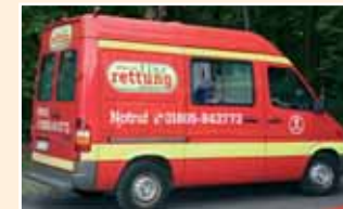
Die Notfallambulanz für Haus- und Wildtiere ist 24 Std. im Münchener Raum im Einsatz

zu bringen. Die „ aktion tier-tierrettung münchen e.V. “ ist ein tierärztlicher Notdienst für Tiere im Münchener Raum. Unter 01805/ 84 37 73 ist die aktion tier-tierrettung münchen 24 Stunden auch für Sie im Einsatz.