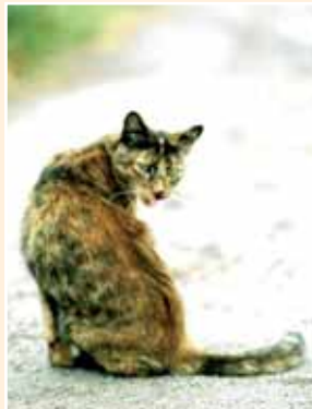
aktion kitty kümmert sich um verwilderte Straßenkatzen

Seit 1993 wurden von aktion tier – menschen für tiere e.V. gemeinsam mit seinen Kooperationspartnern bundesweit ca. 250.000 Straßenkatzen betreut und über 2,5 Mio. EUR für Futter und Kastrationen bereitgestellt. Mit der 2003 ins Leben gerufenen „ aktion kitty “ will aktion tier die Situation der Streunerkatzen weiter verbessern. Zur Koordination der erforderlichen Hilfsmaßnahmen wurden bereits neun Katzenforen in Deutschland gebildet. Im Sommer 2005 wurde durch aktion tier vor den Toren Berlins die erste Katzenbabystation Deutschlands eröffnet.