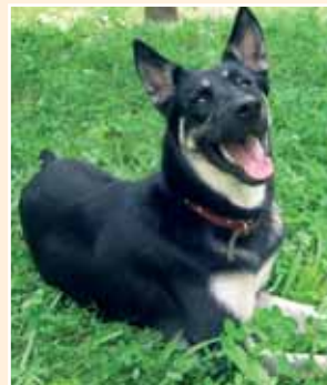
Bevor Sie einen Hund vom Züchter kaufen, kommen Sie zuerst in ein Tierheim in Ihrer Region!

Aktion tier unterhält und betreut mehrere Tierheime, im Inland wie im Ausland. In Crimmitschau (Sachsen) und Teneriffa (Spanien) sind eigene Tierheime entstanden. Insgesamt werden in Deutschland 75 Tierheime durch aktion tier unterstützt. Die hier untergebrachten Tiere verdienen eine Chance auf ein neues Zuhause. Tausende von Tieren werden jedes Jahr ausgesetzt oder abgegeben. aktion tier hilft mittels einer gezielten Aufklärungsarbeit in ca. 4000 Aktionen pro Jahr, um vorbeugend dieser traurigen Entwicklung entgegen zu wirken. Denn Tierhaltung bedeutet Verantwortung. Wenn Sie sich also ein Tier anschaffen möchten und dieses gut durchdacht haben, besuchen Sie eines der zahlreichen Tierheime in Ihrer Region.